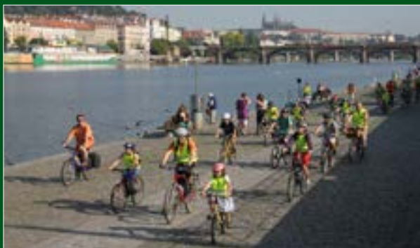
Cyklojízda Waldorfské ZŠ Jinonice