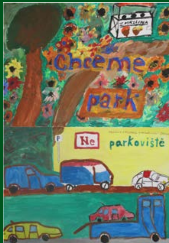
Plakát dětí ze ZŠ Sliveneč – akce Chceme park, ne parkoviště!