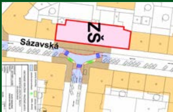
Ukázka z dopravní studie pro ZŠ Sázavská: řešení prostoru před školou, autor Ing. Zbyněk Laube