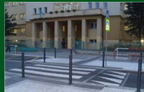
Nový přechod před ZŠ Jeseniova, Praha 3