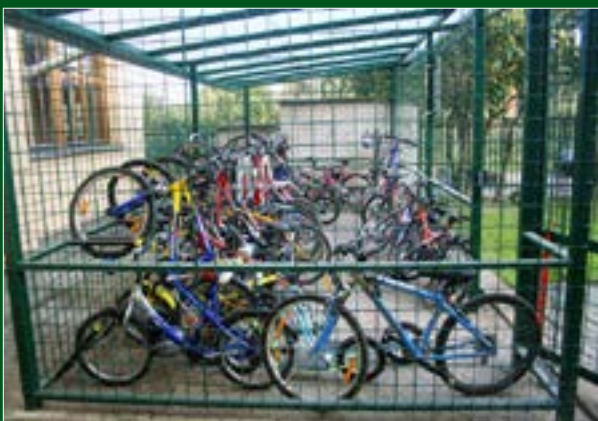
Kolárna u ZŠ Kunratice, foto Květoslav Syrový