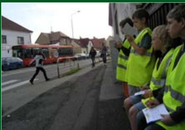
Monitorování dopravy u ZŠ Chvaly, Horní Počernice

Pražské matky, o. s. www.prazskematky.cz prazskematky@ecn.cz Tel.: 257 531 983, 721 761 474