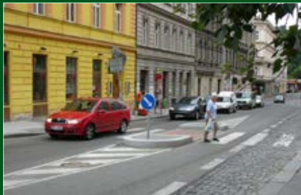
Nový přechod s dělicím ostrůvkem na Rokycanově ulici, Praha 3, projekt Hudbení školy HMP a MC Nová Trojka, foto Pražské matky