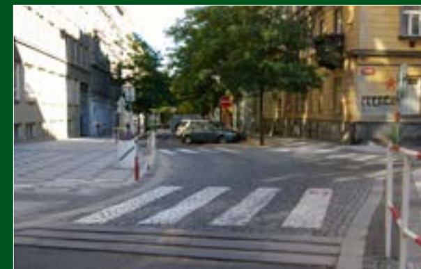
Úprava křižovatky Sázavská x Moravská před ZŠ Sázavská, Praha 2