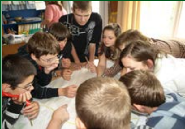
Zpracování školní mapy rizikových míst v ZŠ Sliveneč