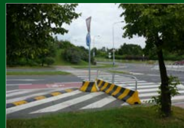
Rozsáhlá rekonstrukce křižovatky ulic Novodvorská x Generála Šišky x Meteorologická v blízkosti ZŠ Meteorologická, Praha-Libuš